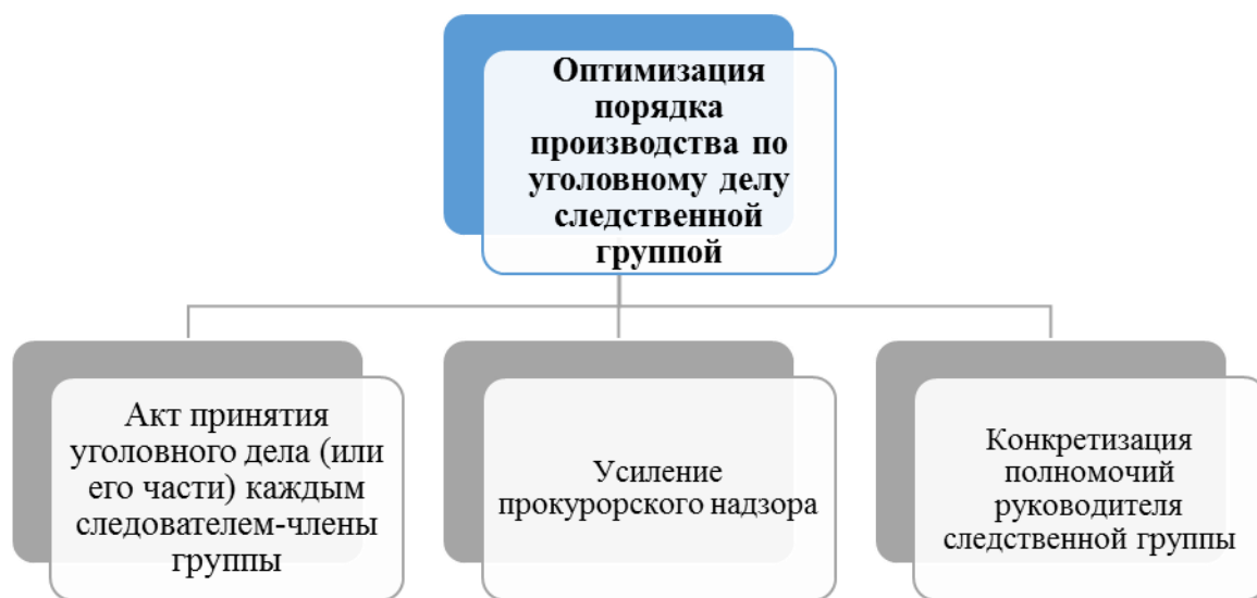
Рис. 2. Схема механизма оптимизации порядка производства предварительного следствия следственной группой