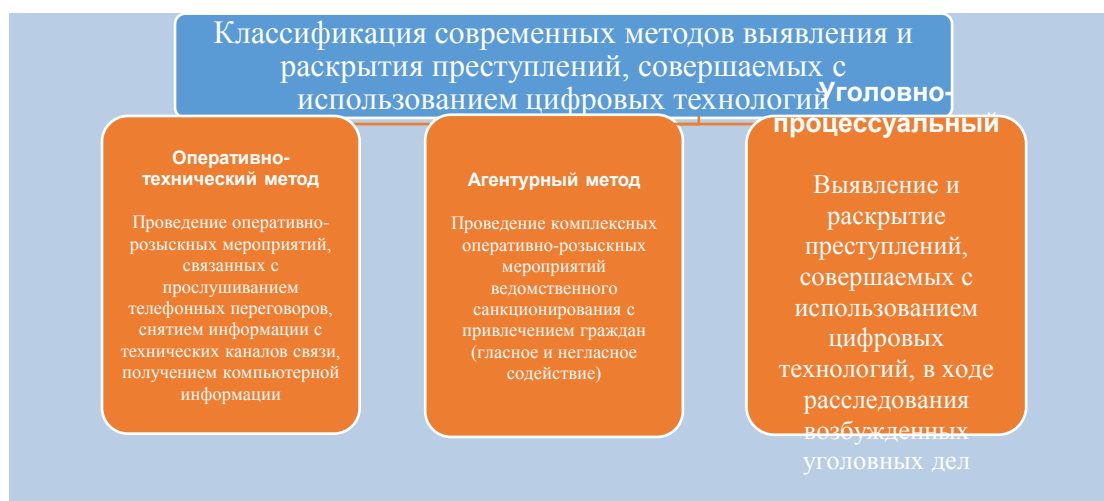
Рисунок 1. Классификация современных методов выявления и раскрытия преступлений, совершаемых с использованием цифровых технологий

Исследование практики деятельности оперативных подразделений органов внутренних дел (далее — ОВД) показало, что наиболее эффективными и доступными методами выявления и раскрытия преступлений, совершаемых с использованием цифровых технологий, являются: оперативно-технический, агентурный и уголовно-процессуальный (рис. 1):