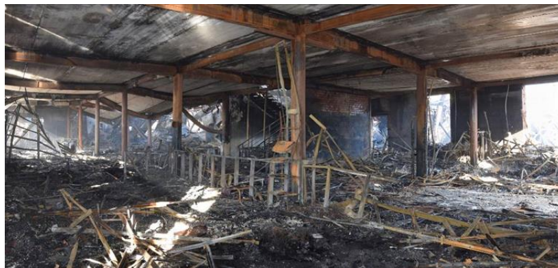
Рис. 1. Панорамный снимок внутреннего объема второго этажа. Вид восточной стены

Была получена информация, предоставленная с прибора приемно-контрольной системы автоматической пожарной сигнализации. Для дальнейшего исследования была получена выписка буфера событий системы противопожарной сигнализации. Установлено, что в качестве управляющего прибора в торговом мебельном центре использовался пульт контроля и управления охранно-пожарный «С2000М». При изучении выписки отмечено, что на объекте в указанное время наблюдаются события «ВНИМАНИЕ» и «ПОЖАР». Данные команды связаны с обнаружением такого опасного фактора пожара, как задымление.